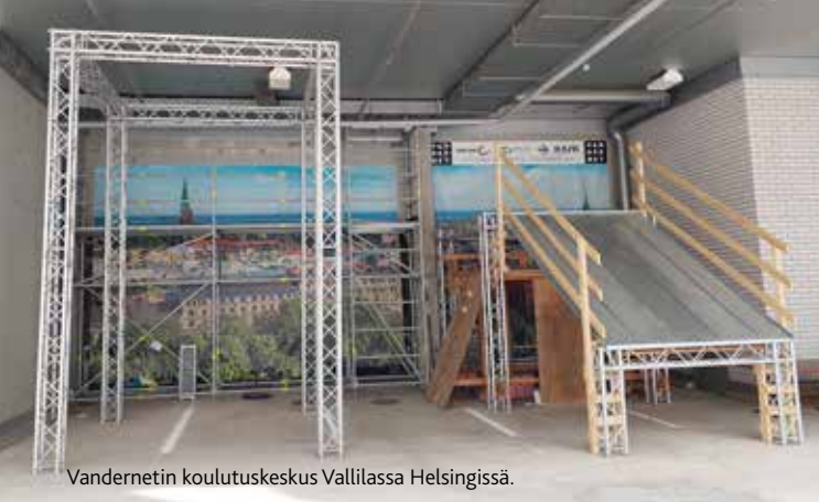
Vandernetin koulutuskeskus Vallilassa Helsingissä.