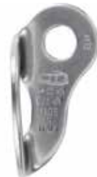
Plate Kit 12x110 mm SS

Suuri kiinnitysaukko helpottaa sulkurenkaiden kiinnittämistä ja mahdollistaa myös kahden paksurunkoisen sulkurenkään kiinnittämisen samaan ankkuriin. 4A10312V1CT0STD